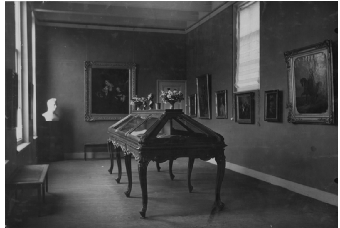
Afb. 5 a, b De opstelling in het Oranje-Nassau Museum te Den Haag, ca. 1930, foto's.

Het grote groepsportret stelt overigens prinses Carolina en haar kinderen voor. Het wordt toegeschreven aan Anton Wilhelm Tischbein. Dit stuk heeft vanaf de opening in 1926 als langdurig