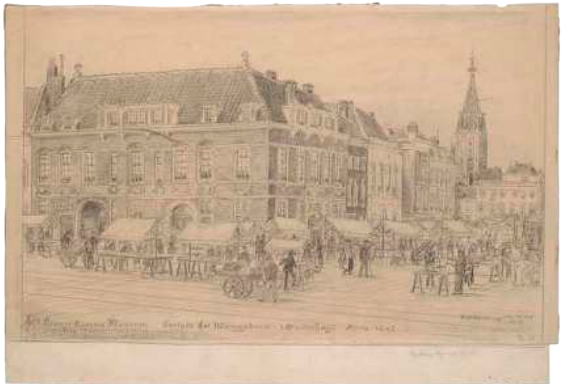
Afb. 2 Eugène Rensburg, Het Oranje-Nassau-museum in de Boterwaag, Den Haag 1915, potloodtekening.

gingen ook gemeentes als Breda behoren en de wervingscirculaire werd zelfs naar de Antillen gestuurd. 2