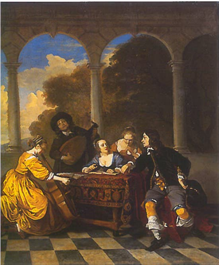
Jacob van Loo (ca. 1614-1670), Musicerend gezelschap . Olieverf op doek 76x65 cm (Hermitage, St. Petersburg).