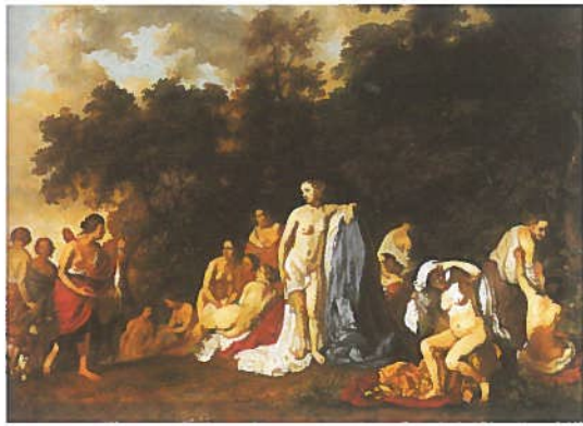
Jacob van Loo (ca. 1614-1670), Diana en haar nymphen , 1654. Olieverf op doek, 99,5x135,5 cm (Statens Museum for Kunst, Kopenhagen).